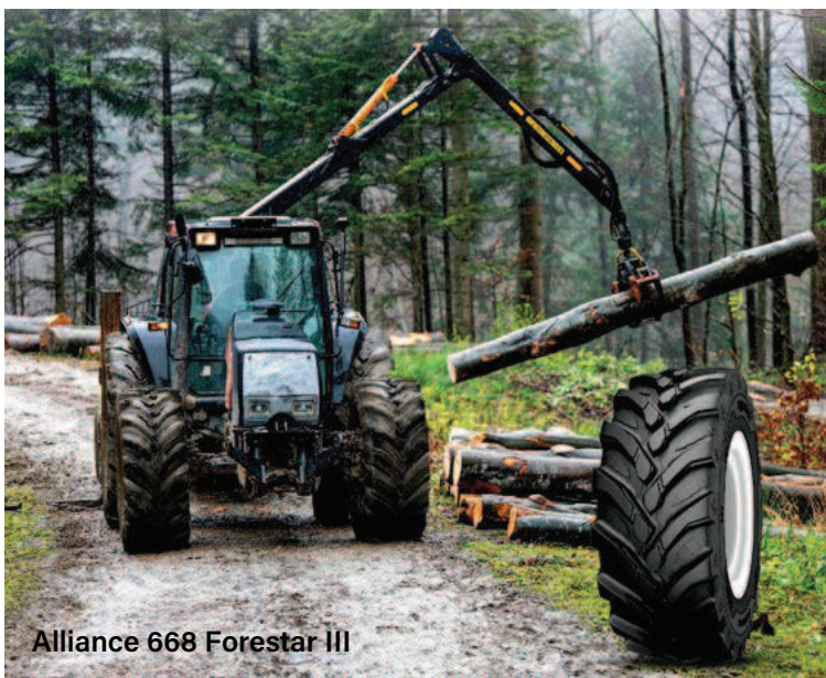
Alliance 668 Forestar III

Nowa w ofercie – Alliance 668 Forestar III to radialna opona do ciągników leśnych gwarantująca przyczepność i stabilność maszyny na mokrych i błotnistych terenach leśnych, przy jednoczesnym dobrym komforcie jazdy na drodze. Posiada wytrzymałą konstrukcję z opasaniem stalowym, co zapewnia trwałość i dłuższą żywotność w ekstremalnych warunkach. Opona jest wyposażona w mocne ściany boczne i szerszy ślad, co gwarantuje odporność na przebicia, sta-