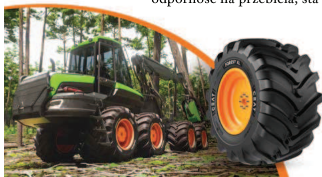
Forest XL CEAT